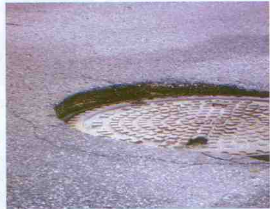
Schadhafte Straßenabschnitte müssen laufend repariert werden.

Vor allem durch die Grabungsarbeiten der Fernwärme sind unsere Gemeindestraßen stark in Mitleidenschaft gezogen worden, die nun schrittweise saniert werden. Neben der Sanierung des Pflasterbelages am Stadtplatz, welche mittlerweile abgeschlossen ist, sind für heuer noch die Generalsanierung der Felberstraße ab der Unterführung bis zur Museumsstraße sowie die Neugestaltung der Hintergasse vorgesehen. Nächstes Jahr geht's weiter unter anderem mit der Kirchgasse, Lebzeltergasse und Hallenbadstraße.