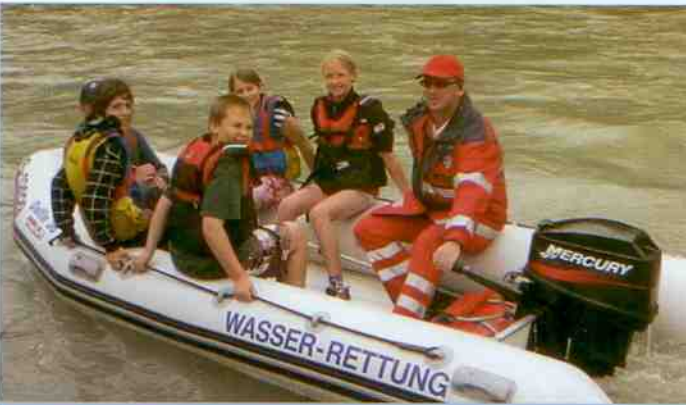
Auch eine Bootsfahrt auf der Salzach konnten die Schüler erleben.

Strömender Regen, der jedoch bald aufhörte, konnte