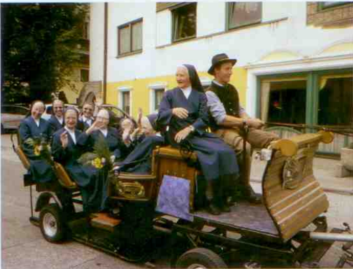
Jahrzehntelanger Einsatz für die Mittersiller Bevölkerung.

Am Sonntag, den 13. Juni, standen zahlreiche Mittersiller Vereine im Spalier vor der Pfarrkirche, um die Barmherzigen Schwestern – welche zuvor von der Bürger- und Trachtenmusikkapelle Mittersill sowie den Schützen