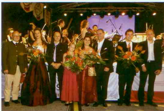
Ein fixer Bestandteil der Mittersiller Veranstaltungen: die Kulturnacht auf dem Stadtplatz.

Genießen Sie die kulinarischen Köstlichkeiten, erfreuen Sie sich an den Klängen hochkarätiger Musikgruppen und erleben Sie den Flair des Nationalparkstädtchens. Von 6.- 8. August 2010 ist es wieder soweit!