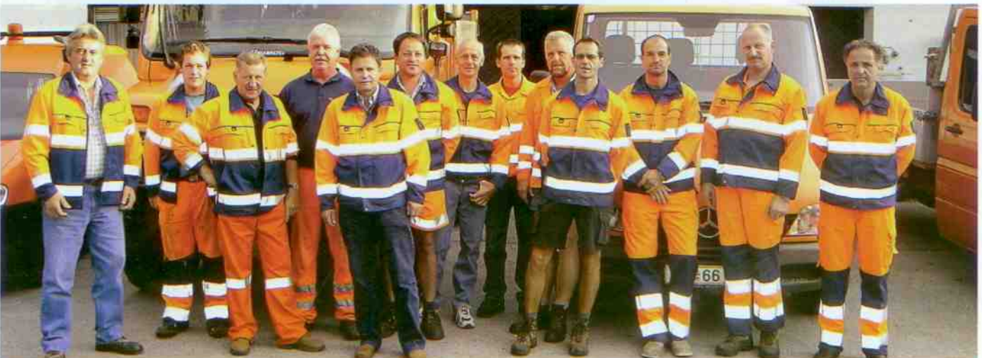
Das Team vom Mittersiller Stadtbauhof erhält mit dem neuen Gebäude einen dem Stand der Technik entsprechenden Arbeitsplatz.

Bei der Präsentation des neuen Bauhofes in einer der folgenden Ausgaben der „Mittersiller Gemeindeinformation“ wird näher auf die Aufgabengebiete der Bauhofmitarbeiter eingegangen.