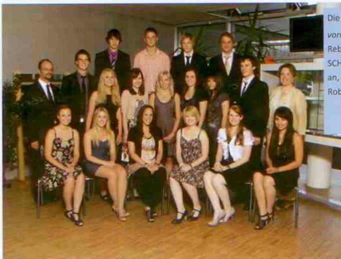
Die Klasse 8A:

Das BORG Mittersill steht unter dem Motto „Freude fördern und Selbstwert stärken“. Auch heuer konnten wieder hervorragende Ergebnisse bei der Reifeprüfung erzielt werden. Gratulation an die erfolgreichen Absolventen!