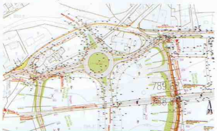
Ein Kreisverkehr soll die Verkehrssituation im Bereich Burk deutlich verbessern.

Berichte über den Verlauf des Projektes folgen in den nächsten Ausgaben.