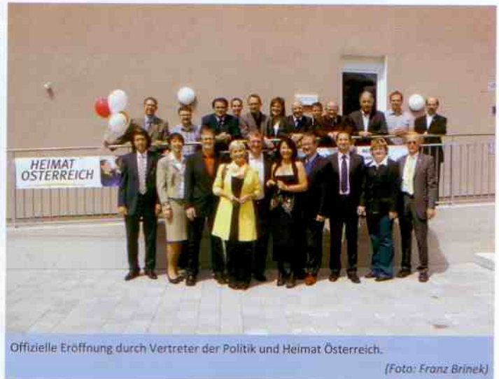
Offizielle Eröffnung durch Vertreter der Politik und Heimat Österreich.