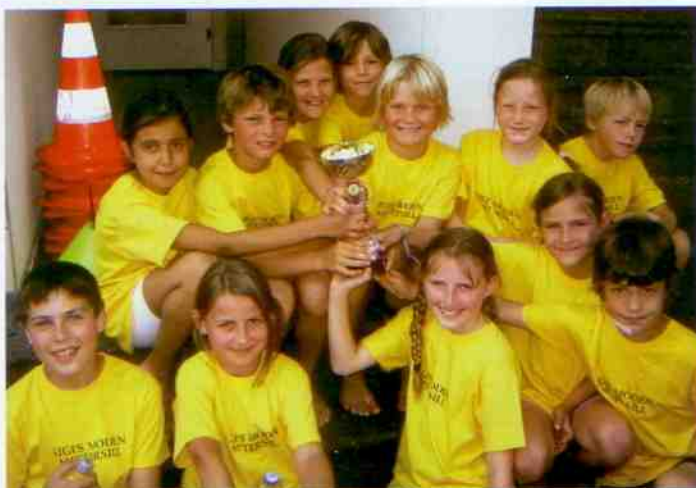
Die Bezirksmeister der Volksschule Mittersill.

Wir sind stolz auf die Leistungen unserer Mädchen und Buben, gratulieren allen Teilnehmern und freuen uns schon auf die Wettkämpfe 2011!