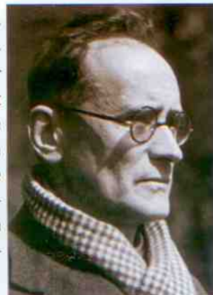
Anton von Webern

Am 15. September 1945 wurde Anton von Webern in Mittersill, wohin er aus Angst vor der Roten Armee geflüchtet war, unbeabsichtigt von einem US-amerikanischen Soldaten erschossen. Der Soldat sollte an einer Razzia im Haus Weberns teilnehmen, da dessen Schwiegersohn des Schwarzmarkthandels verdächtigt wurde. Als Webern vor die Tür trat, um eine Zigarette zu rauchen, stieß er mit einem der Soldaten, die das Haus umstellt hatten, zusammen und es löste sich der tödliche Schuss.